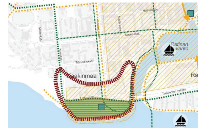
KSOYK, kumottavat kaavamerkinnät